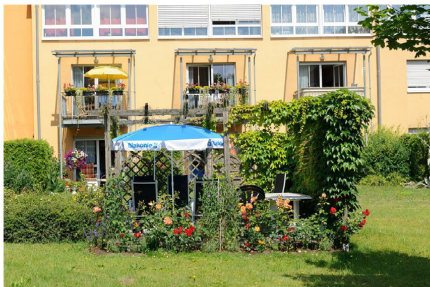
Haus Waldenstein Hof