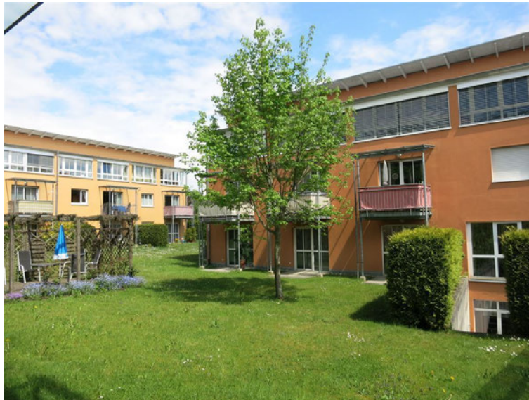
Haus Waldenstein Innenhof