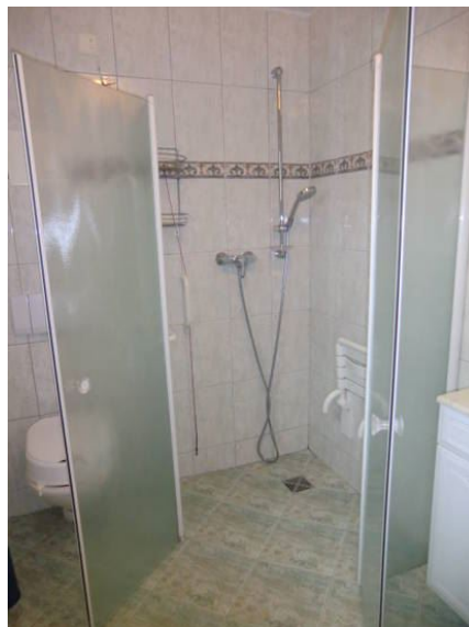
Haus Waldenstein Bad