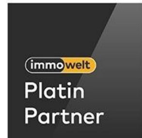
LOGO AKTUELL 2019

Ihr zuverlässiger Partner in Sachen Immobilien.